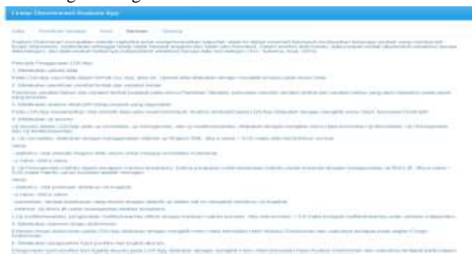
Gambar 8 Menu Bantuan

Menu bantuan berfungsi untuk membantu pengguna dalam melakukan analisis diskriminan. Pada menu bantuan ini terdapat deskripsi singkat dan langkah-langkah dalam melakukan analisis diskriminan.