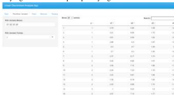
Gambar 11 Pemilihan Variabel pada LDA App

Pemilihan variabel terikat dan variabel bebas terdapat pada menu pemilihan variabel, kemudian memilih variabel terikat dan variabel bebas yang akan dianalisis pada panel yang disediakan.