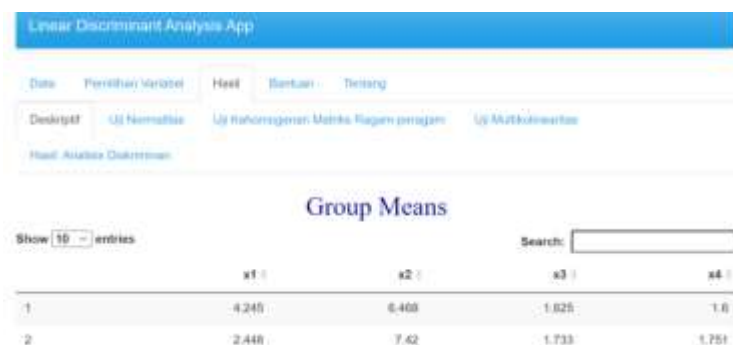
Gambar 12 Statistika Deskriptif pada LDA App

Gambar 12 pada LDA App menunjukkan bahwa pada menu deskriptif menampilkan statistik deskriptif data yaitu rerata kelompok ( group means ).