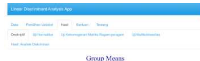
Gambar 3 Menu Statistika Deskriptif

Menu statistika deskriptif berfungsi untuk menampilkan nilai statistik data yaitu rerata kelompok ( group means ).