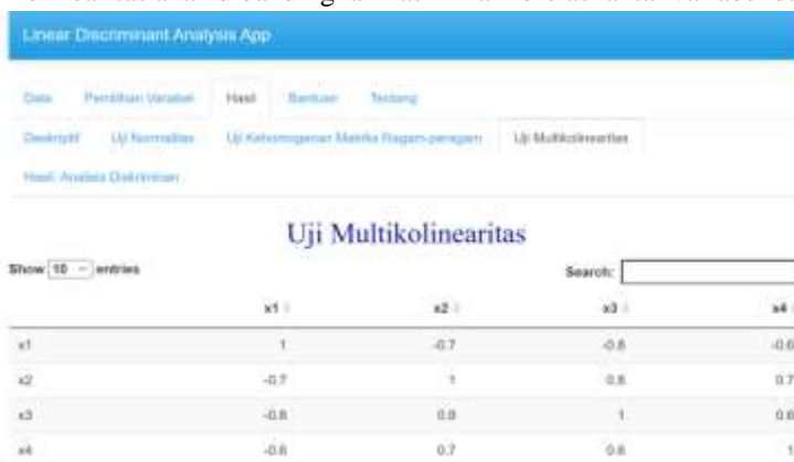
Gambar 15 Uji Multikolinearitas pada LDA App

Pada uji multikolinearitas akan dibandingkan hasil nilai korelasi antar variabel dari LDA App dan R Studio.