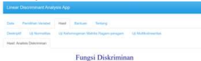
Gambar 7 Menu Hasil Analisis Diskriminan

Menu hasil analisis diskriminan berfungsi untuk mengetahui hasil estimasi fungsi diskriminan, prediksi klasifikasi dan akurasi untuk memperoleh kesimpulan.