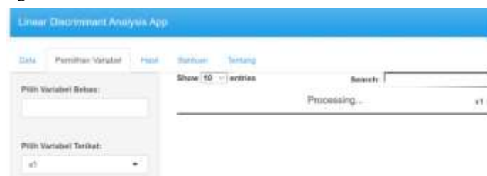
Gambar 2 Menu Pemilihan Variabel

Menu pemilihan variabel digunakan untuk memilih variabel terikat ( dependent variable ) dan variabel bebas ( independent variable ) yang akan dianalisis.