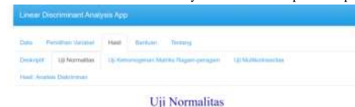
Gambar 4 Menu Uji Normalitas

Uji normalitas dilakukan untuk melihat apakah variabel bebas ( independent variable ) berdistribusi normal atau tidak. Data yang tidak berdistribusi normal akan menyebabkan masalah pada ketepatan fungsi diskriminan.