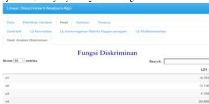
Gambar 16 Estimasi Fungsi Diskriminan pada LDA App

5. Setelah dilakukan uji asumsi, selanjutnya mengestimasi fungsi diskriminan.