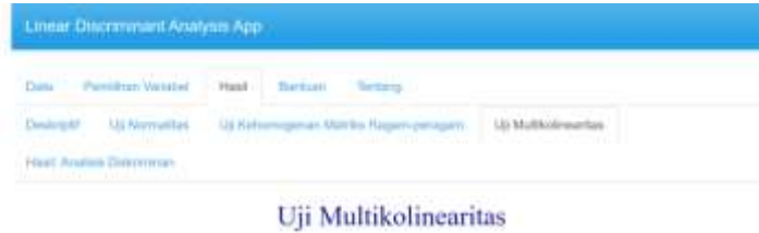
Gambar 6 Menu Uji Multikolinearitas

Uji multikolinearitas dilakukan untuk menguji apakah terdapat korelasi yang kuat antar variabel bebas ( independent variable ). Asumsi yang terpenuhi adalah tidak ada korelasi antar variabel bebas ( independent variable ).