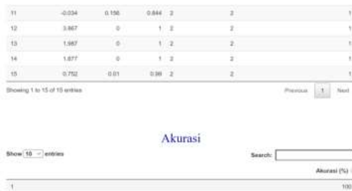
Gambar 18 Tingkat Akurasi pada LDA App

Nilai akurasi hasil klasifikasi pada LDA App dihitung dengan menggunakan confusion matrix . Perhitungan tingkat akurasi klasifikasi terdapat pada persamaan 4.