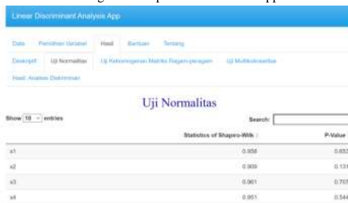
Gambar 13 Uji Normalitas pada LDA App

Pada uji normalitas akan dibandingkan hasil p-value dari LDA App dan R Studio.