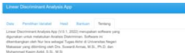
Gambar 9 Menu Tentang

Menu tentang merupakan menu tambahan yang berisi tentang informasi pengembang dan bentuk pencapaian telah selesainya sistem.