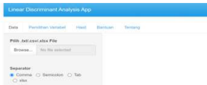
Gambar 1 Menu Data LDA App